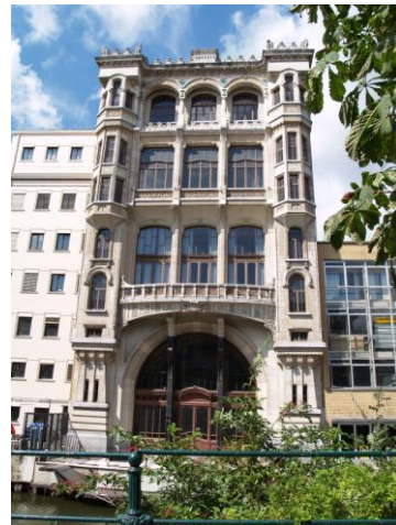
De achtergevel van De Vooruit

het plan op om twee grote toneelzalen boven elkaar te bouwen in de helling – een niet zo voor de hand liggend karwei en ook niet zonder risico. Het plan voorzag ook nog in een indrukwekkende voorbouw op het niveau van de Sint Pietersnieuwstraat, met een café, een restaurant, een winkelruimte, een bibliotheek, en lokalen voor de repetities en vergaderingen van de culturele verenigingen. De voorbouw en de achterbouw werden gescheiden door een wintertuin.