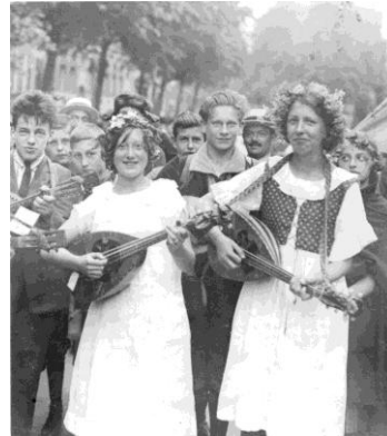
mandoline-orkest van de Arbeiders Jeugd Centrale op 1 mei 1928

Weest gegroet in Brussels dreven, Vrije zangers van het volk. Brenge bezieling in ons leven, Weest van ons gevoel de tolk. Laat uw lied van blij verlangen Jub'lend schallen ver in 't rond, Zingt uw strijd- en zegezangen. Heil U! fieren zangersbond.