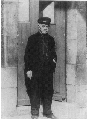
Pierre De Geyter